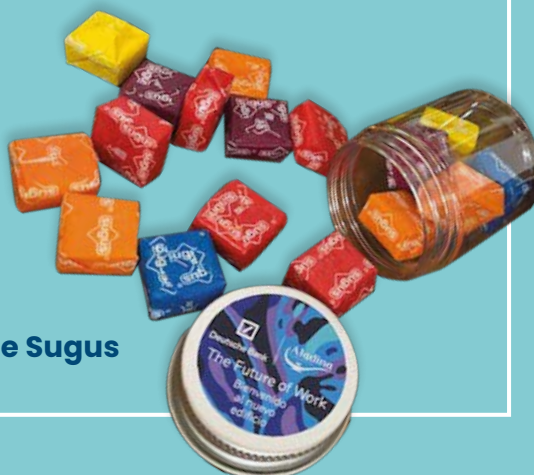
Tarro de Sugus