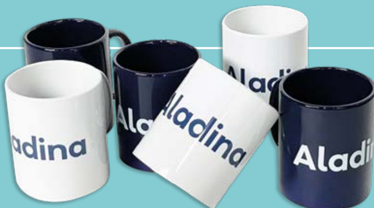
Taza Deseos azul