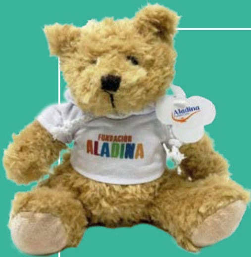
Oso de peluche