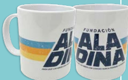
Taza Star Wars