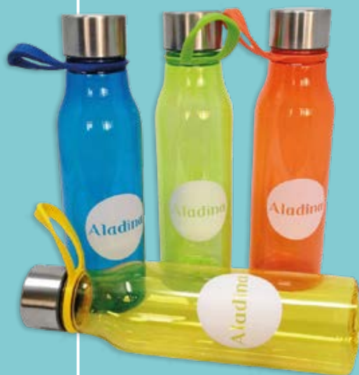
Botella zero waste